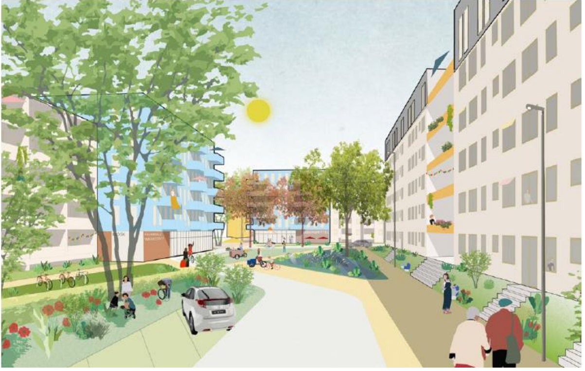
Grafik: Octagon und GM013