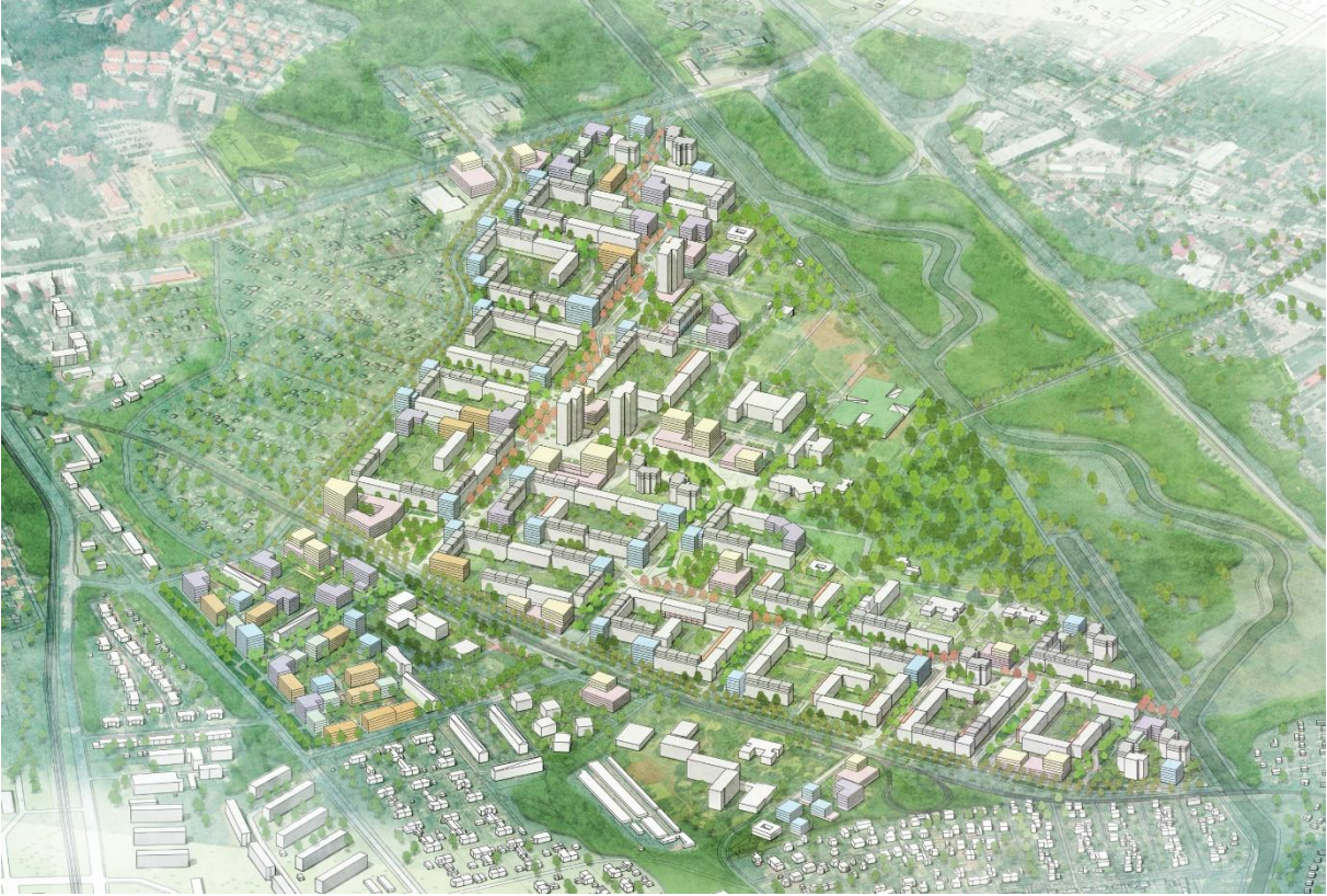
Grafik: Octagon und GM013